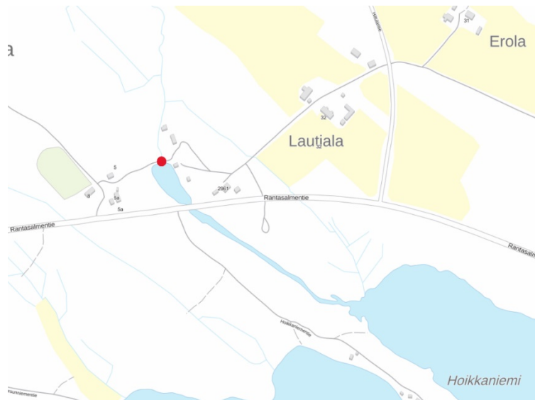
Voimalaitospadon sijainti kartalla

Rantasalmen tekninen ja ympäristölautakunnalle on tullut useita yhteydenottoja eri tahoilta koskien Säyne järven patoa. Kyseessä vesivoimalaitos, jolle on vesioikeuslain (31/1902) nojalla myönnetty pysyttämislupa 14.5.1960. Vesivoimalaitos on purettu, mutta jäljellä on voimalaitospato ja säännöstelypatoja. Yhteydenotot ovat koskeneet padon rapistuvaa kuntoa sekä Säyne järven alhaista vedenpintaa.